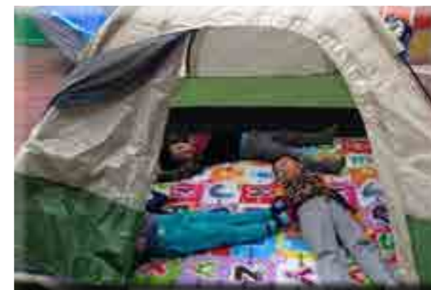
不仅要试帐篷，还要试空间，这不，直接找来小朋友试一试。

可这时一个新的问题出现了，近 30 顶帐篷，完全由园里老师们搭建和收纳，的确是很大的工作量。突然想起：咱小橡树有家长义工群啊，群里有活跃分子 70 多人，承担起所有帐篷的运输、搭建和收纳工作绝对没问题。结果一呼百应，我们的帐篷义工小组瞬间成立。