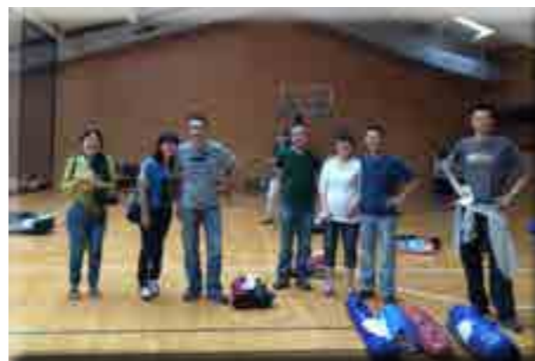
这就是传说中的帐篷拆卸突击队，30分钟完成战斗！