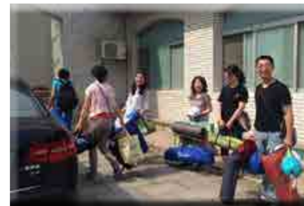
当天一早和小朋友一起到达宽沟，开工！

可这时一个新的问题出现了，近 30 顶帐篷，完全由园里老师们搭建和收纳，的确是很大的工作量。突然想起：咱小橡树有家长义工群啊，群里有活跃分子 70 多人，承担起所有帐篷的运输、搭建和收纳工作绝对没问题。结果一呼百应，我们的帐篷义工小组瞬间成立。