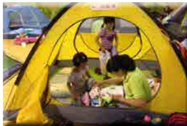
夜晚看着孩子们睡在帐篷里，快乐啊！

最后各班的家长代表准时到篮球馆把各班的帐篷取回就地分配，减少了义工们来回运输拉帐篷的工作，就此我们的宽沟帐篷工作顺利完成！